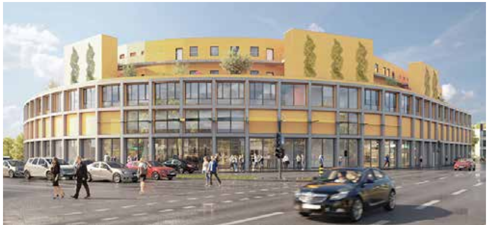
So sollte das „Quartier am Hellweg“ ursprünglich aussehen.