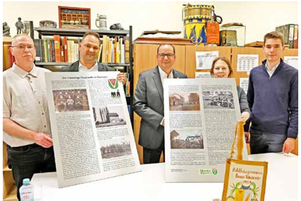
Im Archiv der Bürgerschaft Übrerruhr konnten bereits die neuen Info-Tafeln zur Freiwilligen Feuerwehr begutachtet werden.

Traumaplan® Schmerzcreme: Wirkstoff: Beinwell-Zubereitung (Zubereitung aus frischem Symphytum x uplandicum-Kraut) Anwendungsgebiete: Traumaplan® Schmerzcreme wird angewendet bei Prellungen und Verstauchungen (bei Sport- und Unfallverletzungen), Muskel- und Gelenkschmerzen infolge stumpfer Verletzungen. Warnhinweise: Enthält Sorbinsäure, Propylenglycol und den Duftstoff Rosmarinöl (enthält Limonen). Packungsbeilage beachten. Zu Risiken und Nebenwirkungen lesen Sie die Packungsbeilage und fragen Sie Ihre Ärztin, Ihren Arzt oder in Ihrer Apotheke. Stand Nov-2024