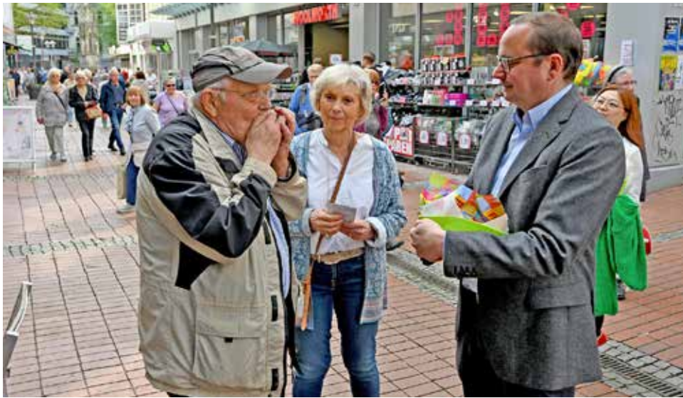
Bei dem Projekt verteilen ehrenamtliche Mitglieder der Caritas St. Laurentius und des Treffpunkt Steele kostenlos Gebäck, Kaffee, Tee und Mineralwasser in Steele.