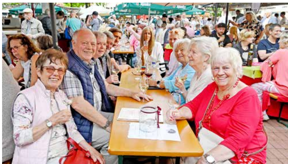
Ausprobieren! In Steele präsentieren sich bereits bekannte und neue Winzer.