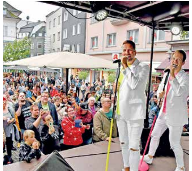
Schlager, Dancemusik, Pop und Rock, diese Stilrichtungen haben die Neon-Jungs drauf.