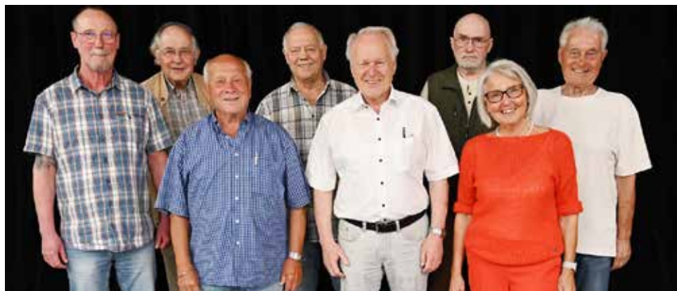
Unser Foto zeigt das neue Vorstandsteam des AWO-Ortsvereins in der Oststadt.

Haus unterm Regenbogen · Gewalterberg 40 · 45277 Essen-Überruhr