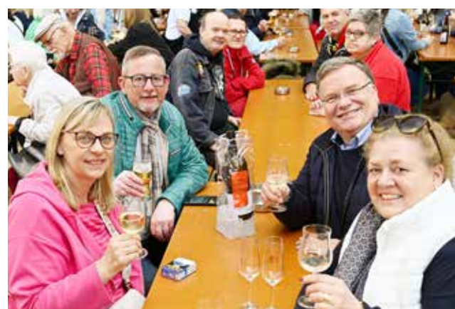
Auch die CDU-Lokalpolitiker schauen beim Steeler Weinfest sehr gerne vorbei.