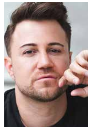
Popschlager mit Just Dimi.

Unter dem Motto „Karneval ist kein Datum - Karneval ist ein Gefühl“ organisiert die AKG nun das „1. AKG Sommer Open Air“ auf dem Vorplatz der Burgruine in Burgaltendorf, Burgstraße 2. Los geht's am Samstag, 28. Juni, Einlass ist ab 15, Beginn um 17 Uhr. Bei Getränken und Grillspezialitäten soll es neben der Live-Musik auch karnevalistische Über-