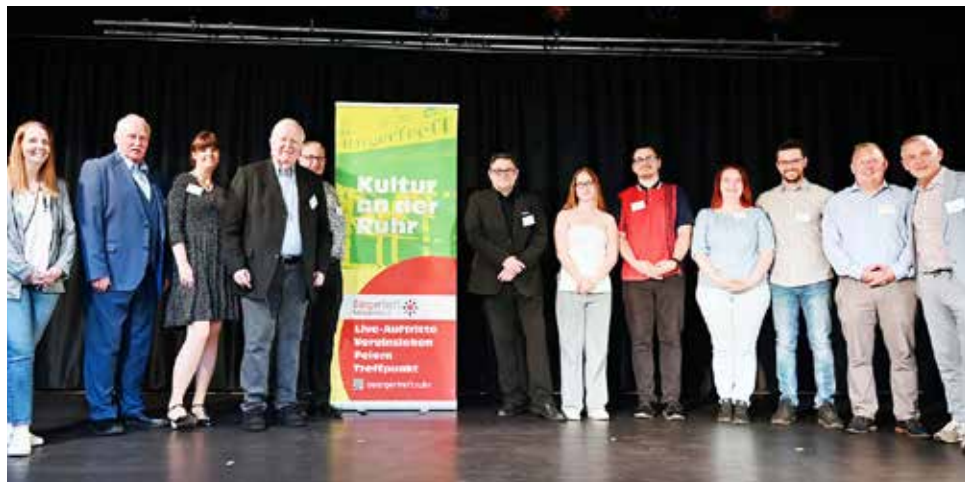
Glückwunsch! 10-Jahres-Feier in der guten Stube der Ruhrhalbinsel am Nockwinkel.

Der Trägerverein gründete sich nach vielen Gesprächen im April 2015. Erste Maßnahmen waren natürlich die Sanierungsmaßnahmen nach dem Beschluss des Rates der Stadt Ende 2016. Auch während Corona und nach dem Brand 2023 wurde der Verein von der Allbau GmbH, der Verwaltung, der Bezirksvertretung, Sponsoren und Förderern begleitet, beraten, unterstützt, gefördert und somit vieles ermöglicht. Heute ist der BürgerTreff nicht nur im Stadtteil verwurzelt und vernetzt, sondern im Bezirk und über Essen hinaus eine bekannte Institution geworden. Und das nicht nur in der Kulturszene.