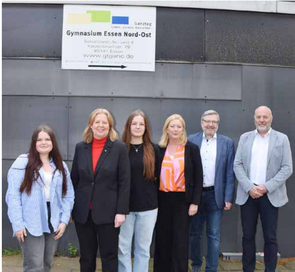
Bundestagspräsidentin Bärbel Bas (2.v.l.) besuchte die Schüler am Gymnasium Essen Nord Ost.