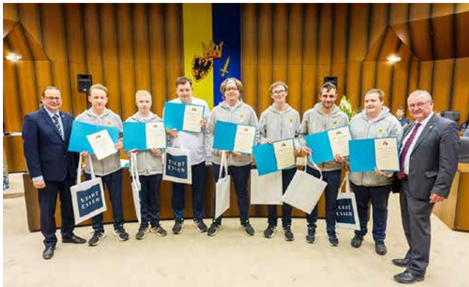
Unser Foto zeigt die Ehrung der Futsal-Mannschaft des DJK Franz-Sales-Haus für den Gewinn der Silbermedaille bei den Special Olympics World Games 2023.