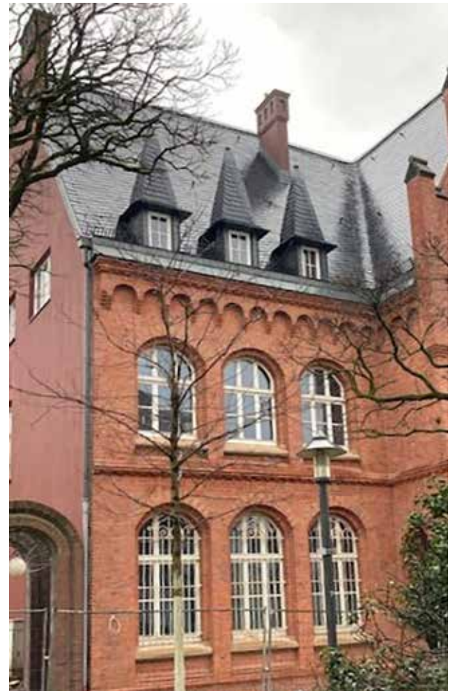
Im Rahmen der Dacharbeiten am Kulturforum Steele wurden die drei Spitzen im linken Dachbereich wiederhergestellt.