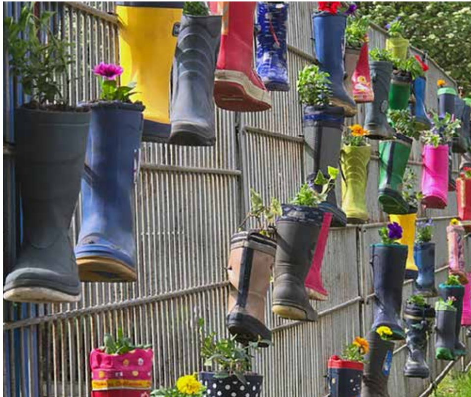
Bei der Pflanzaktion auf dem Schulhof im Hörsterfeld wurden alte Gummistiefel mit Erde und Pflanzen gefüllt und an dem Zaun der Schule angebracht.

Kürzlich hat der Förderverein der Astrid-Lindgren-Schule mit Unterstützung engagierter Eltern eine Pflanzaktion auf dem Schulhof im Hörsterfeld durchgeführt. Hierzu wurden alte Gummistiefel mit Erde und Pflanzen gefüllt und an dem Zaun der Schule angebracht. Die Mitglieder des Round Table 26 unterstützten bei der Aktion und übergaben den symbolischen Scheck an die Schulleitung