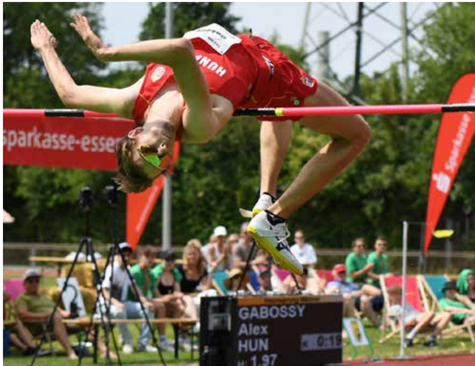
Das Starterfeld beim „Tag der Überflieger“ in Übrerruhr ist wieder international besetzt.

Schon am heutigen Freitag, 26. April, 19.30 Uhr, wird an der Buderstraße das Heimspiel gegen den FSV Duisburg angepfiffen.