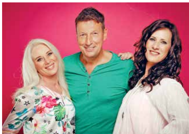
Dana kennt die Musikgarten-Atmosphäre bereits und Neon und Playa Rouge sind in Steele keine Unbekannten.