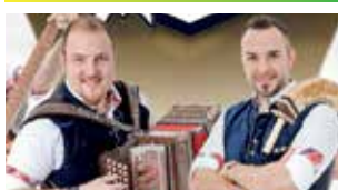
DIE ORIGINAL MÜHLBACHTALER

SONNTAG 12.5. 15.00 PLAYA ROUGE 16.00 DAS GUTE LAUNE DUO