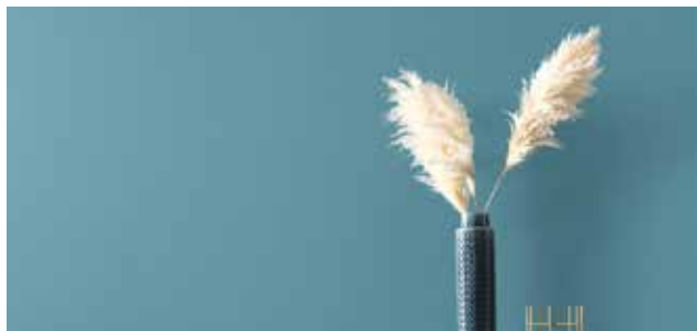
Leichtigkeit und Behaglichkeit vermittelt die Designfarbe Petrolblau.

Erst der persönliche Stil macht aus vier Wänden ein Zuhause. In ihrem Zusammenspiel prägen Farben, Möbel, Leuchten und Wohnaccessoires entscheidend die Atmosphäre jedes Raums und verleihen ihm einen individuellen Charakter. Entscheidenden Einfluss an der Atmosphäre eines Raums haben die Wandfarben. Für eine einfache Orientierung