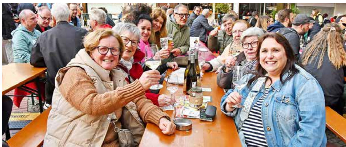
Das wird lecker: Acht Winzer präsentieren in diesem Jahr ihre Weine in Steele- Archivfotos: Janz / ICS

7 WEINGUT Siebenhof VII WEINGUT MIT TRADITION